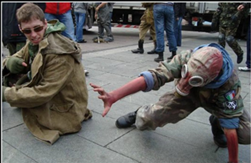
Снорками не рождаются, ими становятся.

Дегтярёву надо было переждать несколько часов во что бы то ни стало. Он достал спальный мешок. -ГГ не устал и не может сейчас уснуть. - сказал спальный мешок. -А вот хрен тебе !!! - возмутился Дегтярёв и сладко захрапел в кровати.