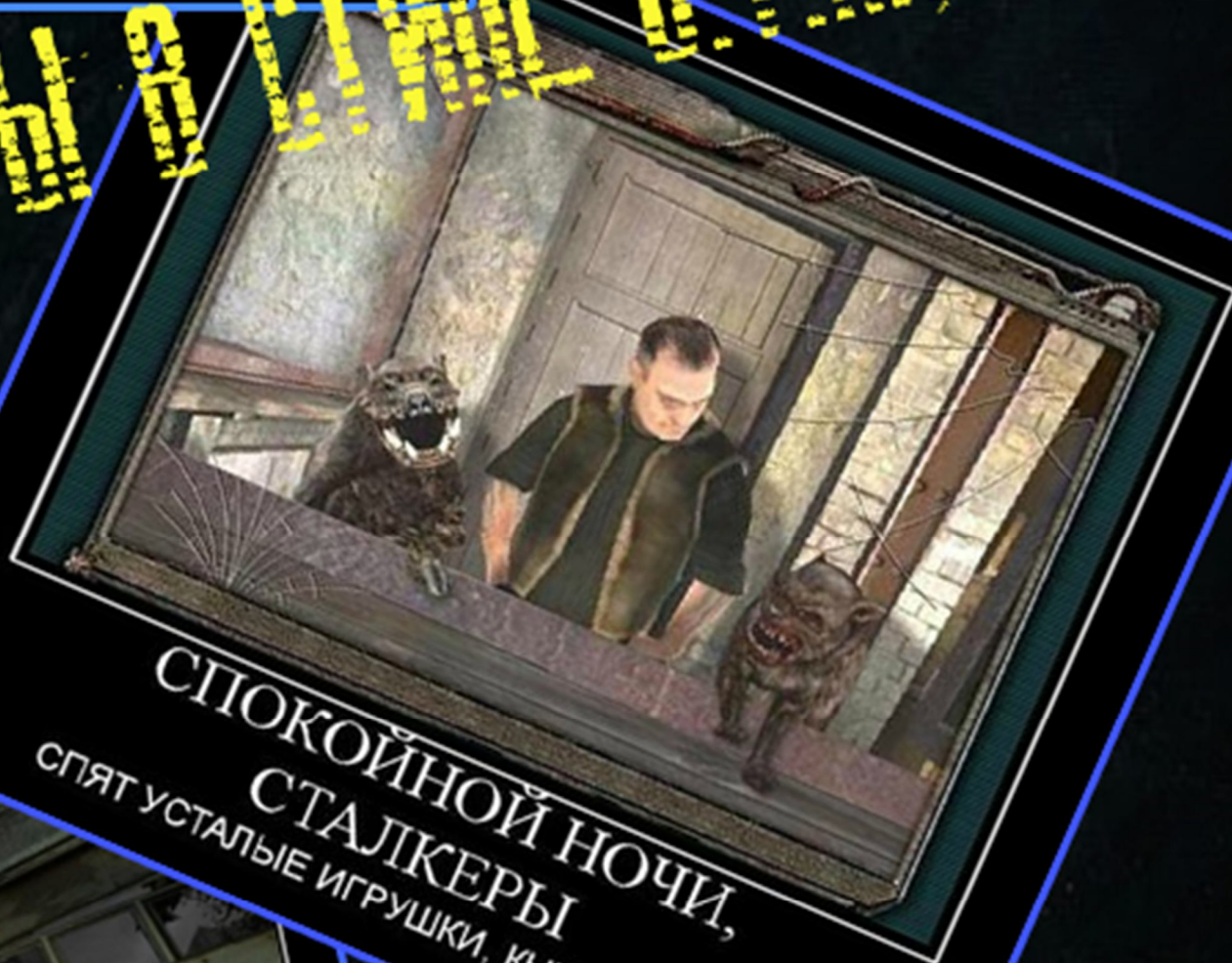
СПОКОЙНОЙ НОЧИ, СТАЛКЕРЫ СПЯТ УСТАЛЫЕ ИГРУШКИ, КНИЖКИ СПЯТ

Вот накоплю денег, куплю себе вольту конкретную... – рассуждал бандит, сидя у костра. - Это вряд ли ... - подумал Дегтярёв, зарабатывая очередной хэдшот.